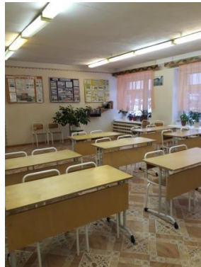
ФОТО УЧЕБНОГО КАБИНЕТА ПО ПРЕДМЕТУ «ХИМИЯ» С ИМЕЮЩИМСЯ ОБОРУДОВАНИЕМ