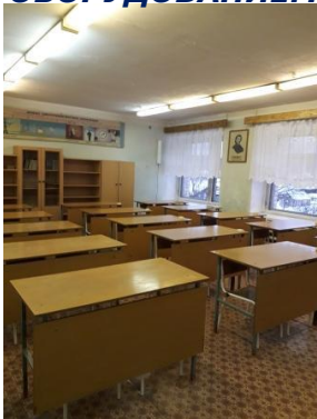
ФОТО УЧЕБНОГО КАБИНЕТА ПО ПРЕДМЕТУ «ФИЗИКА» С ИМЕЮЩИМСЯ ОБОРУДОВАНИЕМ